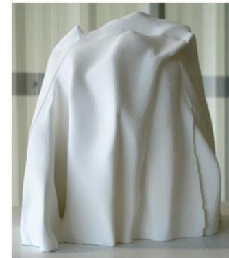
IMPRESION 3D DE LOS MÓDULOS.